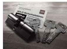
Sicherheitszylinder mit Sicherungskarte

Sicherheitstürblatt mit Stahlverstrebenungen und 2 durchgehenden Stahlplatten im Türblattinneren sowie 11-fach Tresorbolzen-Verriegelung