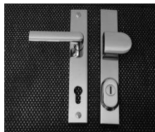
Sicherheitsdrücker mit Aufbohr- und Kernziehschutz