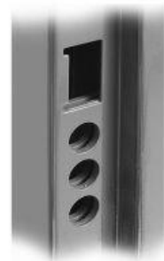
Sicherheitszarge aus Stahl mit 3-fach Stahlplatteneinlage