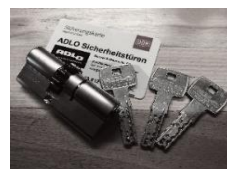
Sicherheitszylinder mit Sicherungskarte

Sicherheitstürblatt mit Stahlverstreben und 2 durchgehenden Stahlplatten im Türblattinneren sowie 11-fach Tresorbolzen-Verriegelung