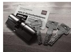
Sicherheitszylinder mit Sicherungskarte

Sicherheitstürblatt mit Stahlverstreben und 2 durchgehenden Stahlplatten im Türblattinneren sowie 11-fach Tresorbolzen-Verriegelung