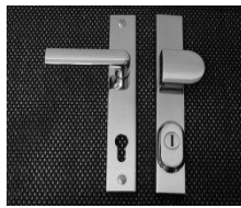
Sicherheitsdrücker mit Aufbohr- und Kernziehschutz